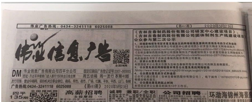
2020年5月25日 第一次报纸公示