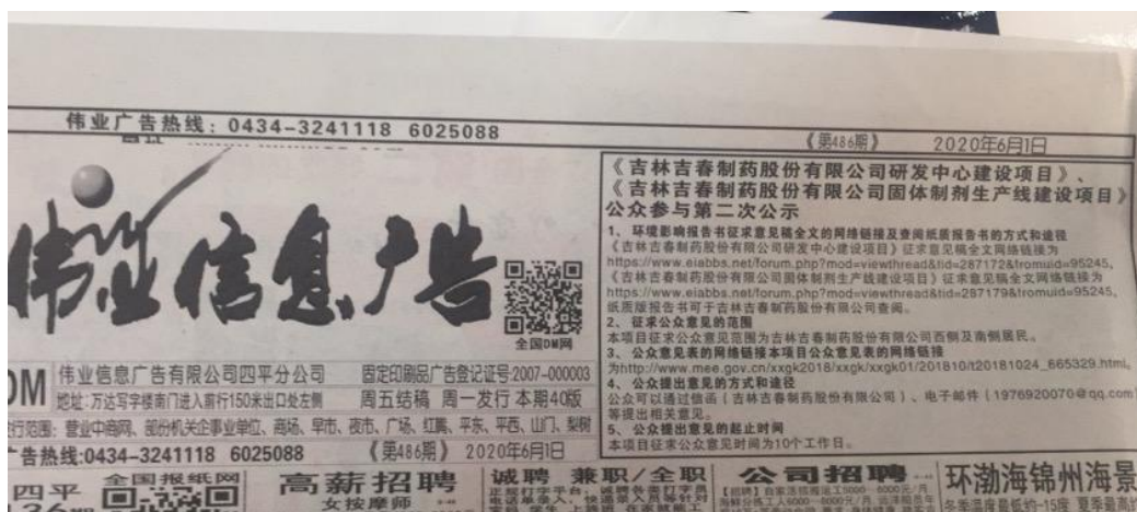
2020年6月1日 第二次报纸公示